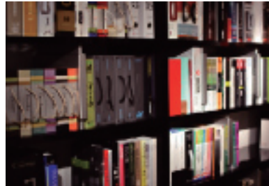
豊富なカタログ、サンプル帳を閲覧可能