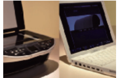
ネット接続可能なノートPCやコピー機も