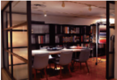
ミーティングやプランニングなどに

地下鉄銀座線【外苑前駅】を上がってすぐ、という便利な立地をぜひ皆さまに有効活用していただきたいと思っております。