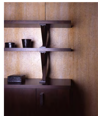
Art Wall LEGEND