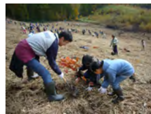
昨年の植樹祭より

今回のフェアでメインをかざるテーブル類は無垢材を多く使用しております。 そこで、旭川家具工業協同組合が行っている植林活動に協賛金をお願いして、森を育てる活動を支援していきたいと思っております。お客様にもこういった場で活動内容をアピールできればと考えています。