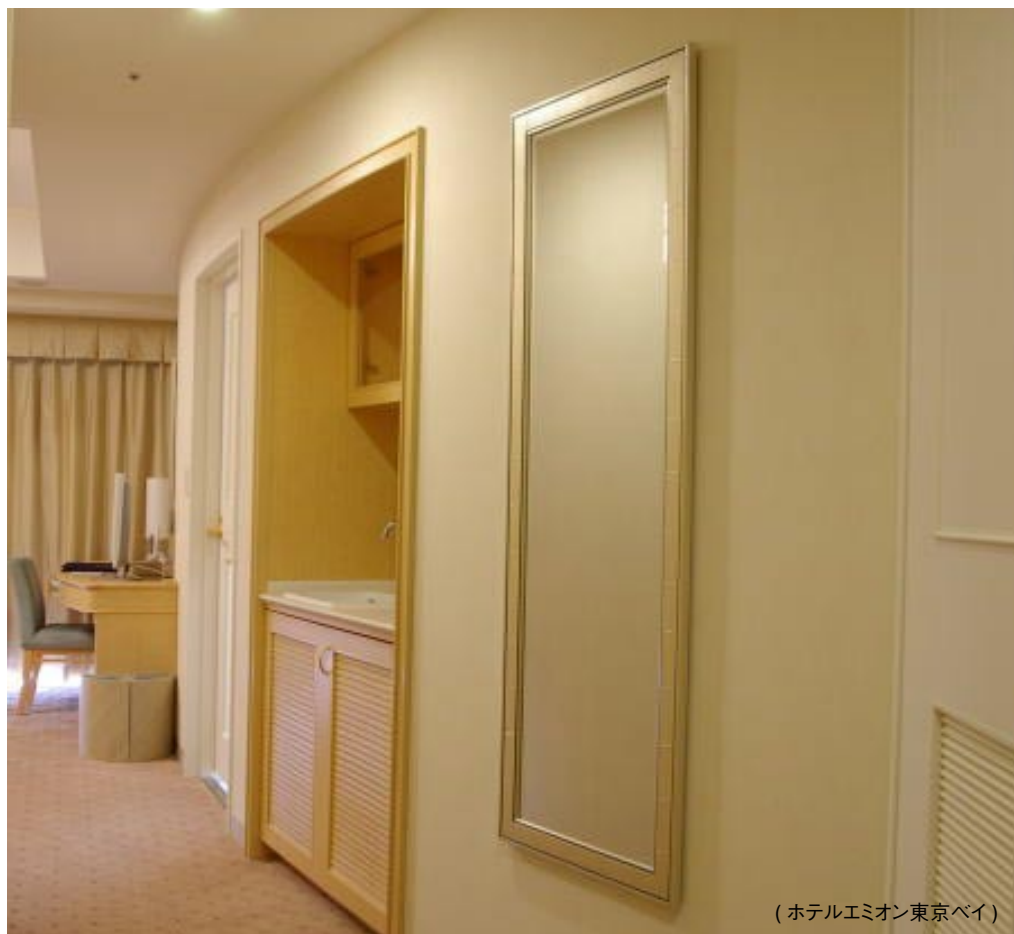
(ホテルエミオン東京ベイ)

この商品は昨年11月のホテルエミオン東京ベイ見学会でご覧なった方も多いと思います。豊かな生活環境の創造を目指し、インテリア空間に対応した様々なアートワークやインテリアモチーフの提供をさせていただいております『インターカルチャーアート』から、この度新たに、樹脂製のモールディングを使用したコントラクト用のデコレーションミラーをご紹介します。製造技術の発達により、自然の木材と変わらない質感と強度を持ったフレームができるようになりました。また木材のモールディングに比べ重量も軽く一括で生産するためコスト的にも抑えることが可能であり数量が必要となるホテルなどのプロジェクトに最適です。さらに、多様なデザインからお選びいただけます。壁面への取り付け用金具としてインターカルチャー