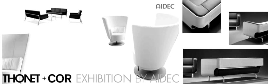
THONET + COR EXHIBITION BY AIDEC