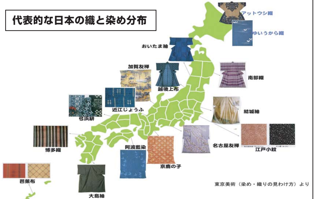
東京美術（染め・織りの見わけ方）より