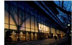
プロジェクト写真(表参道ヒルズ)

◆とき 2012年3月7日(水) 午後6時30分～9時 (午後6時00分から受付開始)